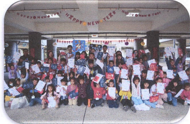
圖為中寮國小服務隊服務情形

偏鄉孩子的寒暑假，不外乎是待在家中看日升日落。這也是我們在辦理此次活動，老師們在設計課程時，始終圍繞著「世界」的初衷。透過這些多元的課程內容，我們將世界帶進偏鄉。在老師們的陪伴下，孩子們能感受到心中的溫暖，打開視野，看到這個世界的豐富。