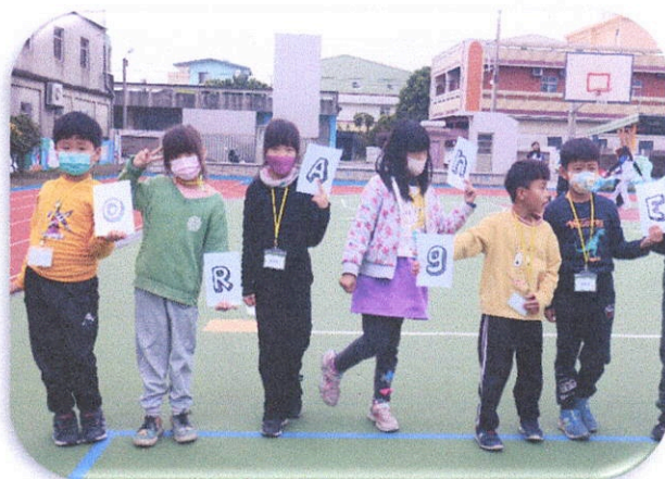
圖為潮洋國小服務隊服務情形