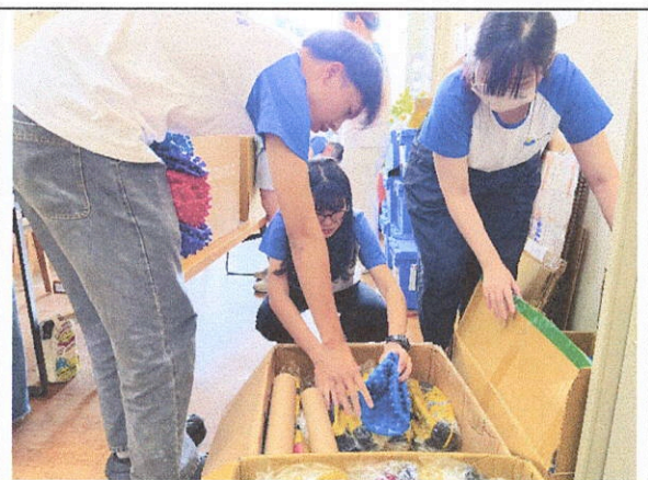
圖為：志工打包文具及體育用品