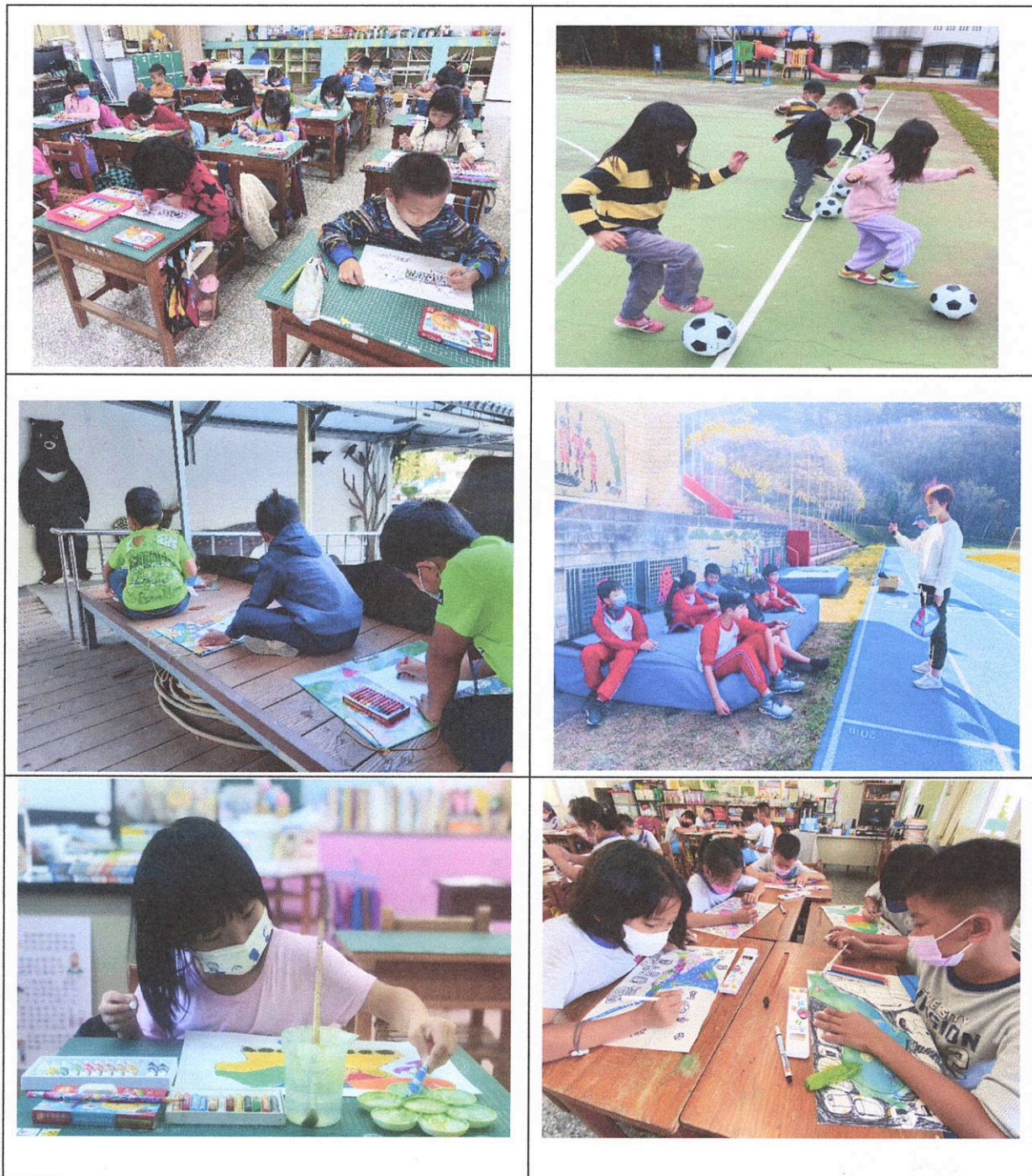
圖為：孩子們使用美術及體育用品上課情形

我們輔助學校，以校方的需求提供物資，讓老師能傳授專業的知識，孩子們也能專心地學習、創作。