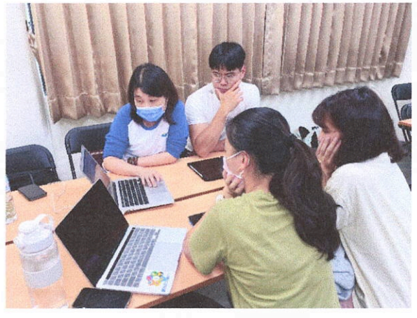
圖為：招募說明會及培訓課程上課情形