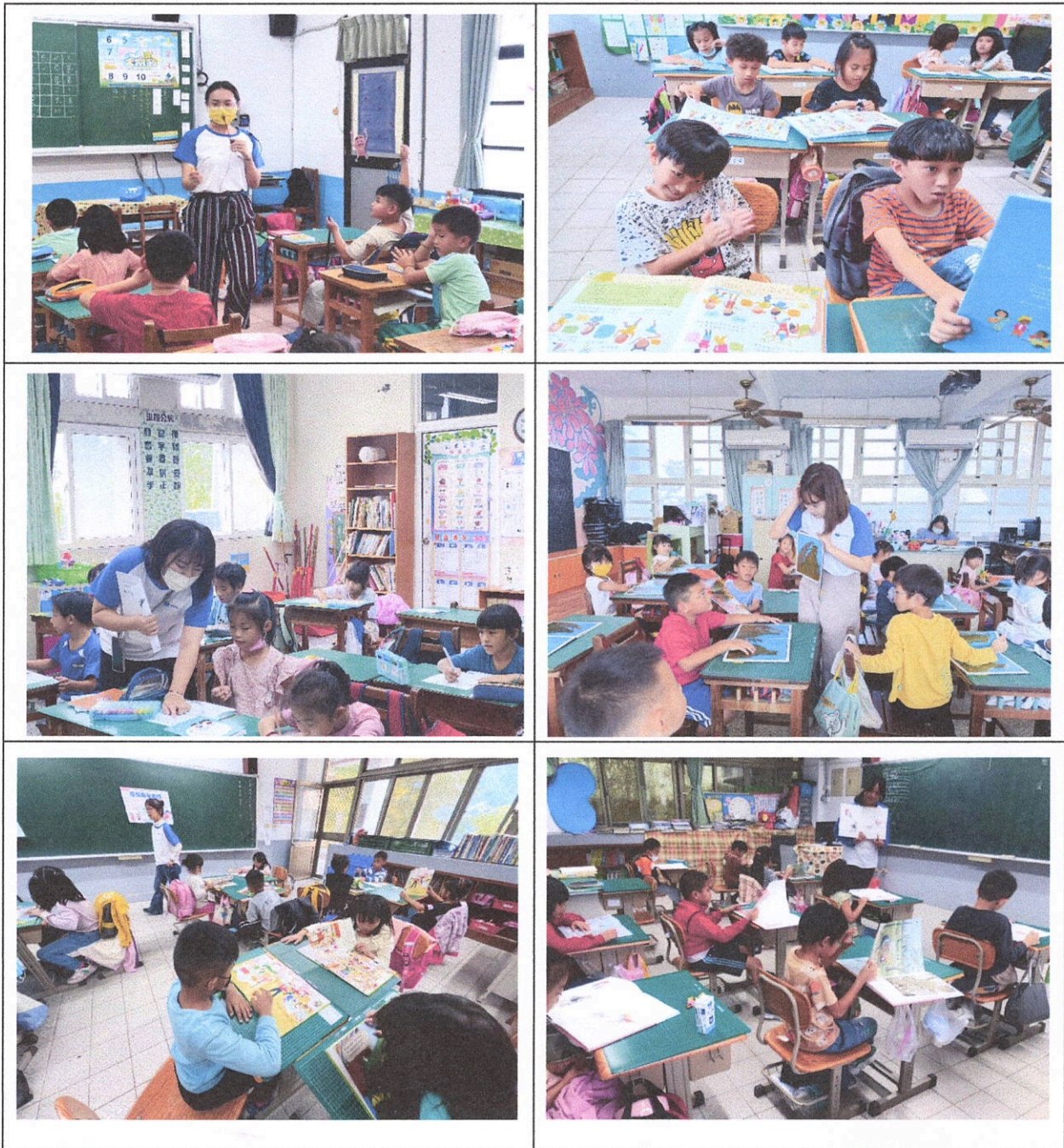
圖為：老師上課情形